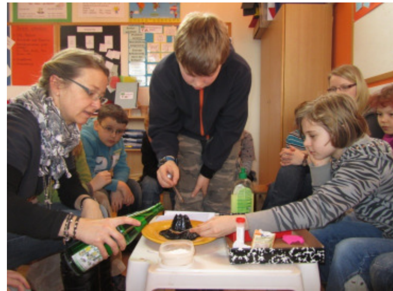
und ein Vulkanausbruch im Klassenzimmer.