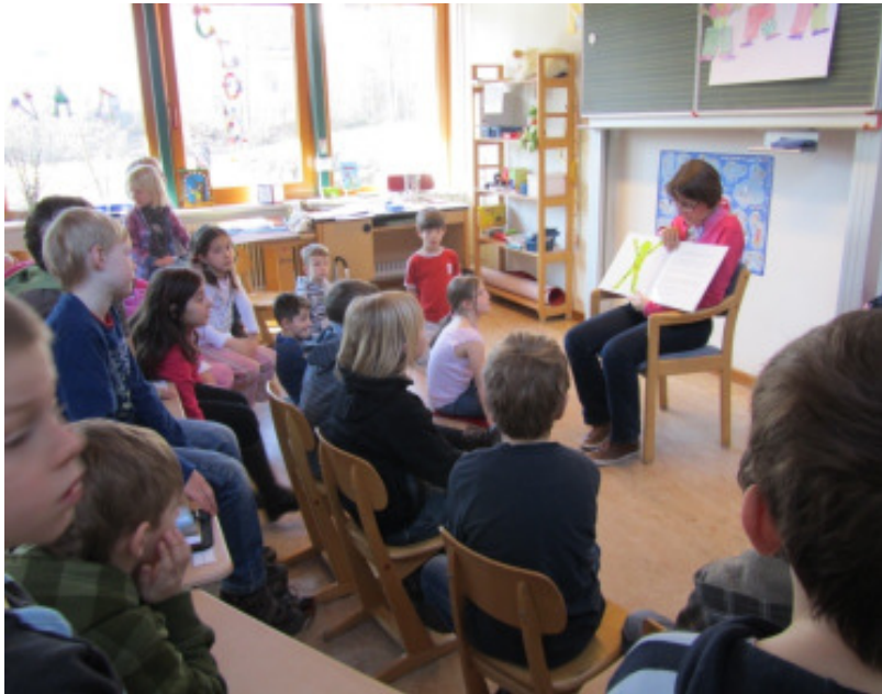
Was steckt in unserem Frühstück?