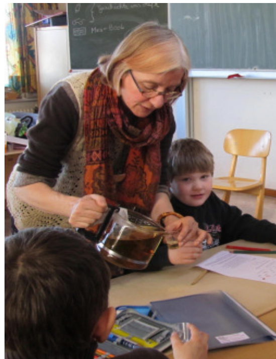
Wie schmeckt Brennnesstee?