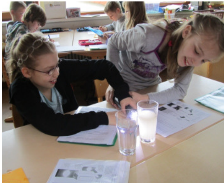
Was passiert mit dem Licht?