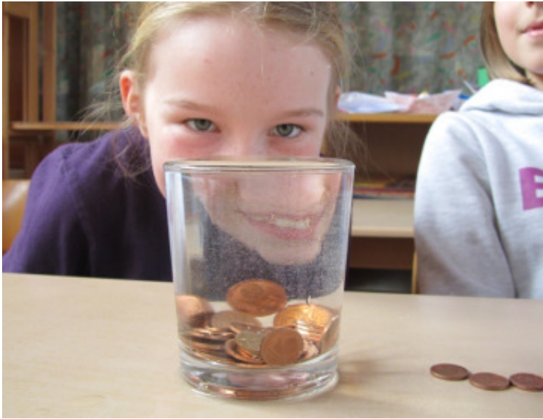
Wasser ist spannend! - ein Experiment zum Thema Oberflächenspannung