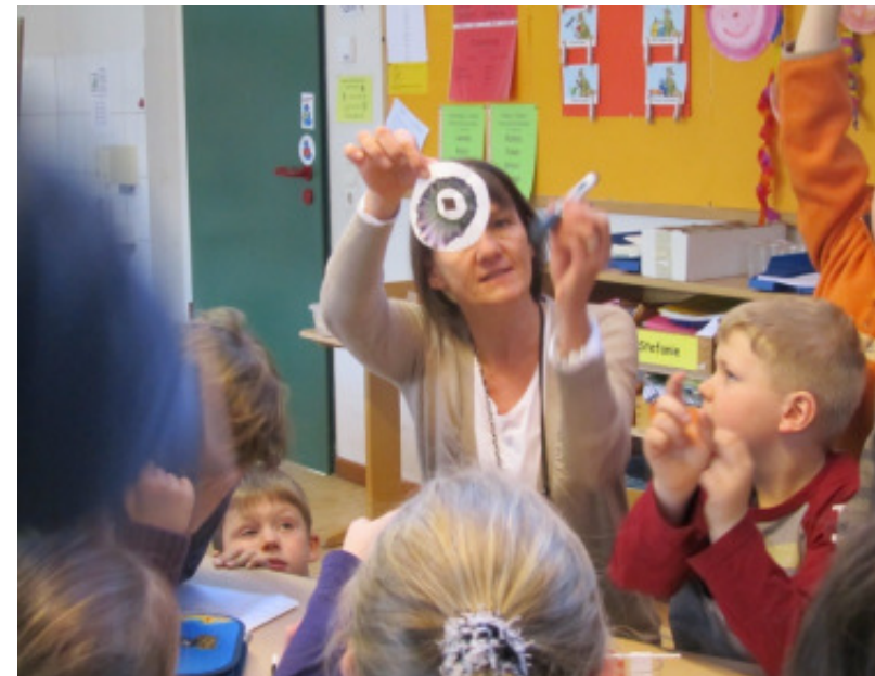
Aus welchen Farben besteht Schwarz?