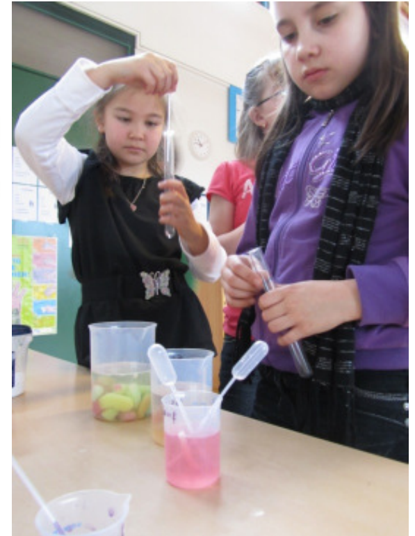
Enthalten Süßigkeiten eine Säure?