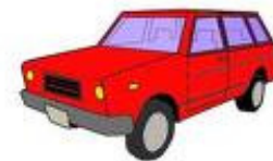
und ein Auto aus Abfall.