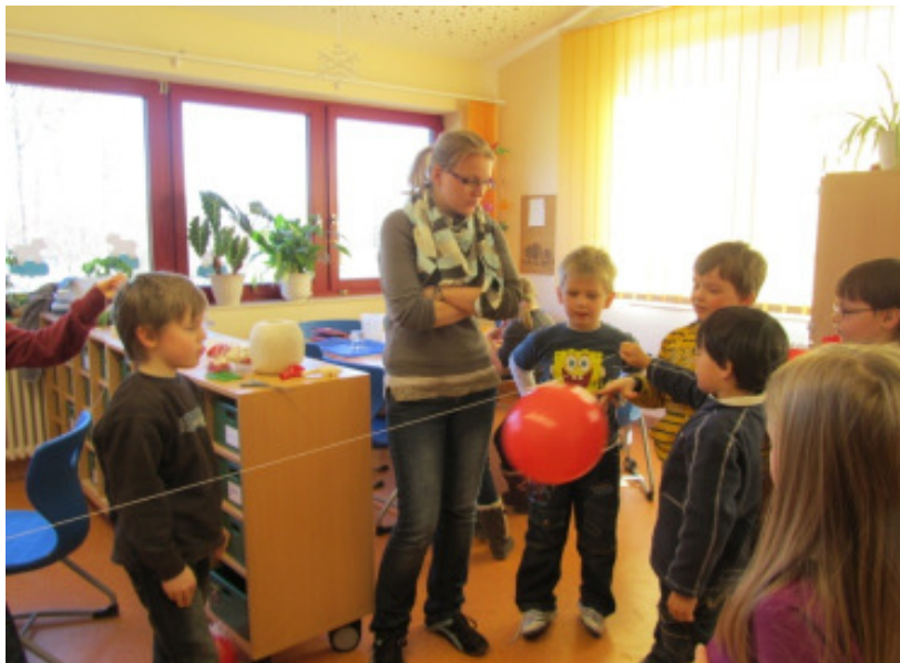
Ein Experiment aus Küche und Bad