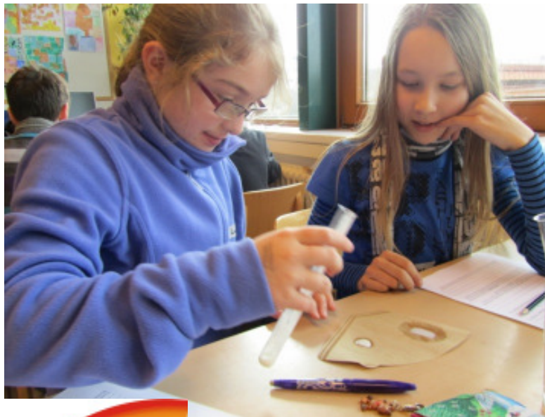
aus besteht die Milch?