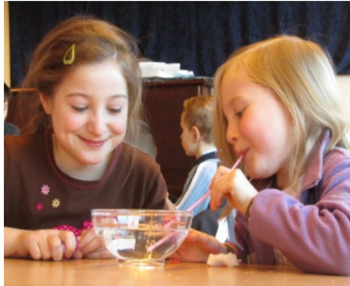
Kann man Luft sehen?