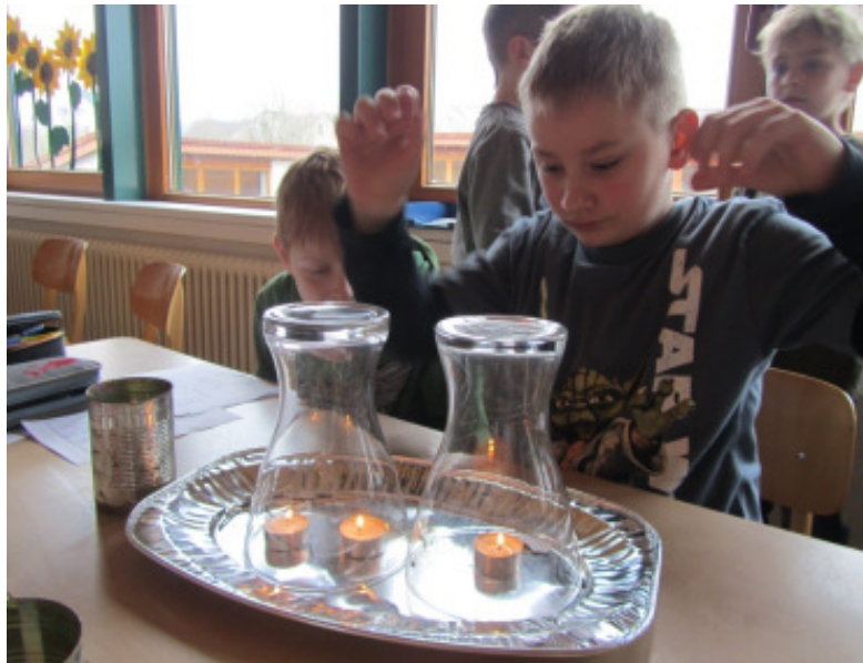
Ein feuriges Experiment